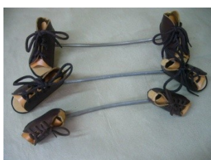
Férula Dennis Brown Método Ponseti